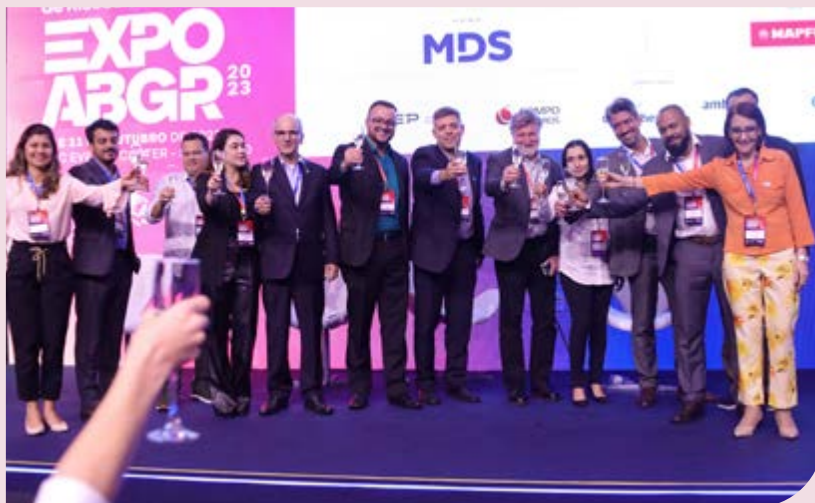
Diretoria, assessores e conselheiros da ABGR para o brinde clássico dos 40 anos da entidade ABGR's board, assistants and advisors gather a classic toast in honor of the entity's 40th anniversary