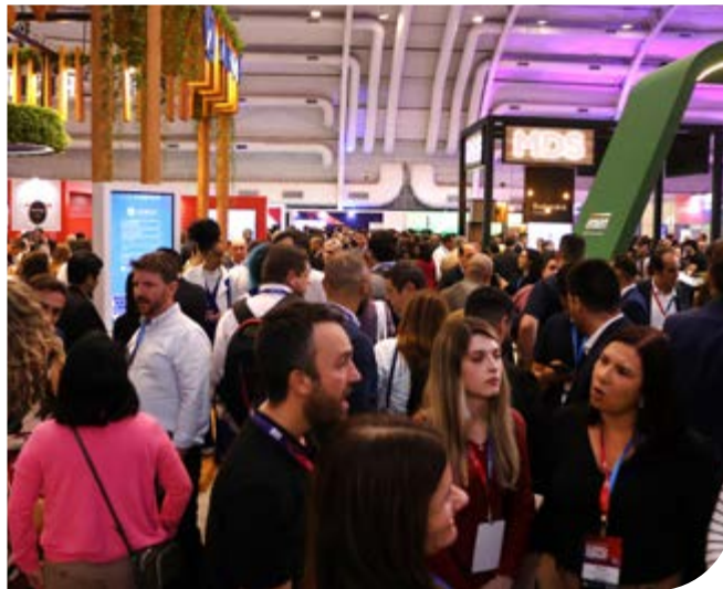
Mais de 1.600 pessoas lotaram a área de exposições: sucesso More than 1,600 people filled the exhibition grounds: a success